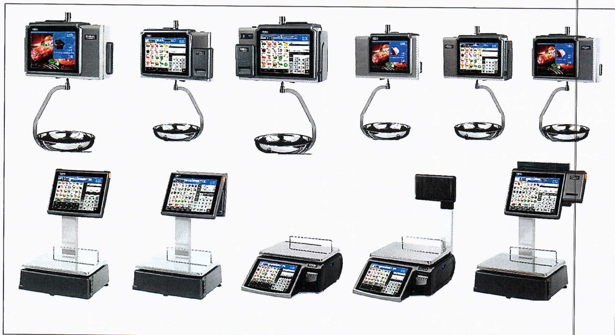
Слика 2. Пример изгледа ваге тип D-900 серије