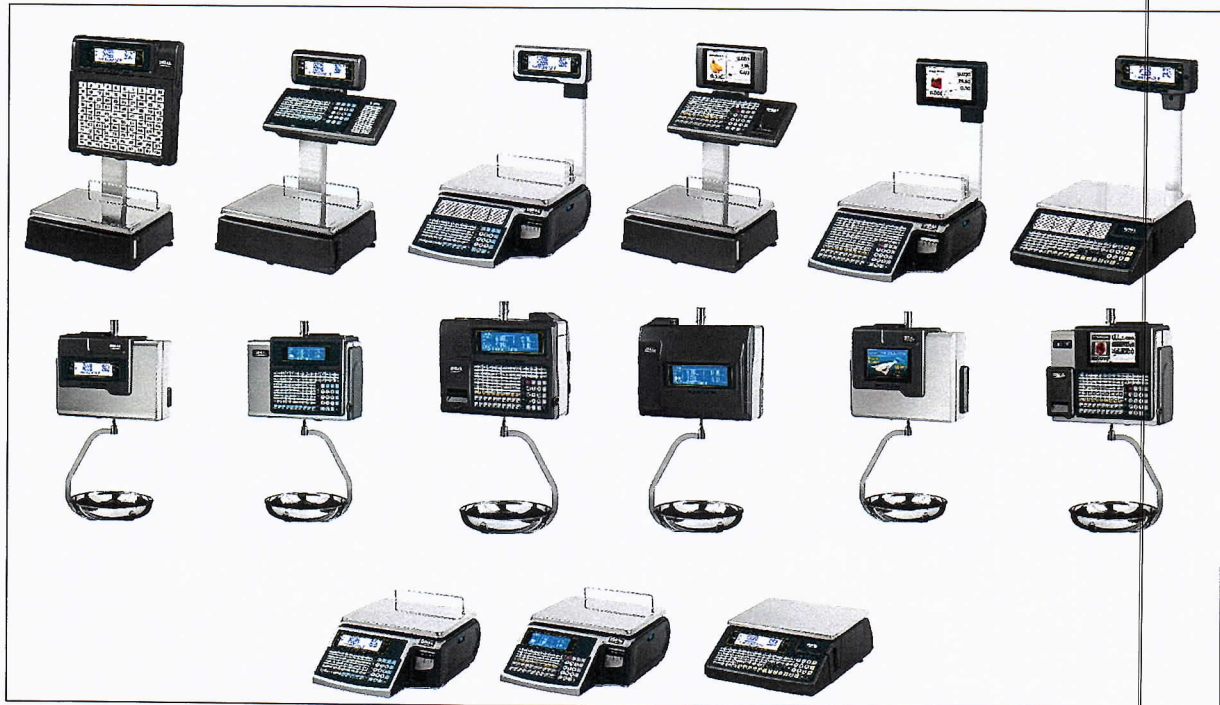
Слика 1. Пример изгледа ваге тип 500